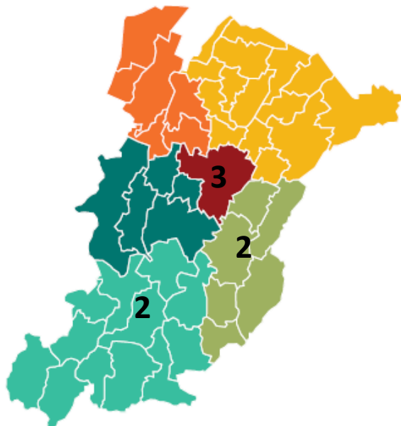
Casi per Distretto Sanitario di residenza