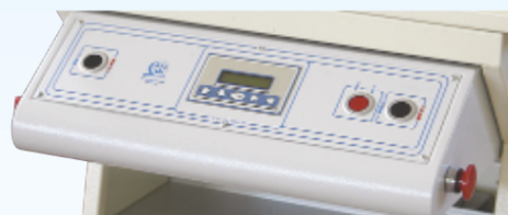
PANNELLO COMANDI SUPERVENUS SUPERVENUS CONTROL PANEL PANNEAU DE CONTRÔLE SUPERVENUS