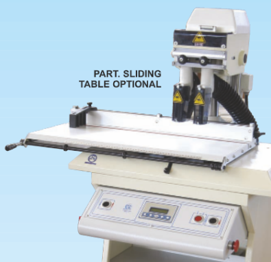
PART. SLIDING TABLE OPTIONAL

Les caractéristiques mécaniques sont les mêmes que la VENUS 3 avec l'ajout d'un régulateur de vitesse des mèches, d'un régulateur de la vitesse de descente des dispositifs permettant d'obtenir la vitesse idéale pour la perforation de tous les types de matériaux, particulièrement utile pour les matériaux en plastique et les papiers plastifiés. In option, on peut équiper tous les modèles d'une table coulissante. En ce cas ils deviennent: 220/TM-225/TM-230/TM-235/TM.